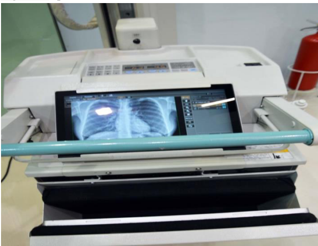
Figura 3: Aparelho Mobile ArtECO- Shimadzu/ Com retrofit.