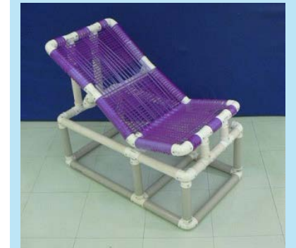
Cadeira de PVC