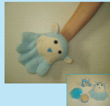
Espumas e luvas