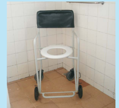
Cadeira de banho