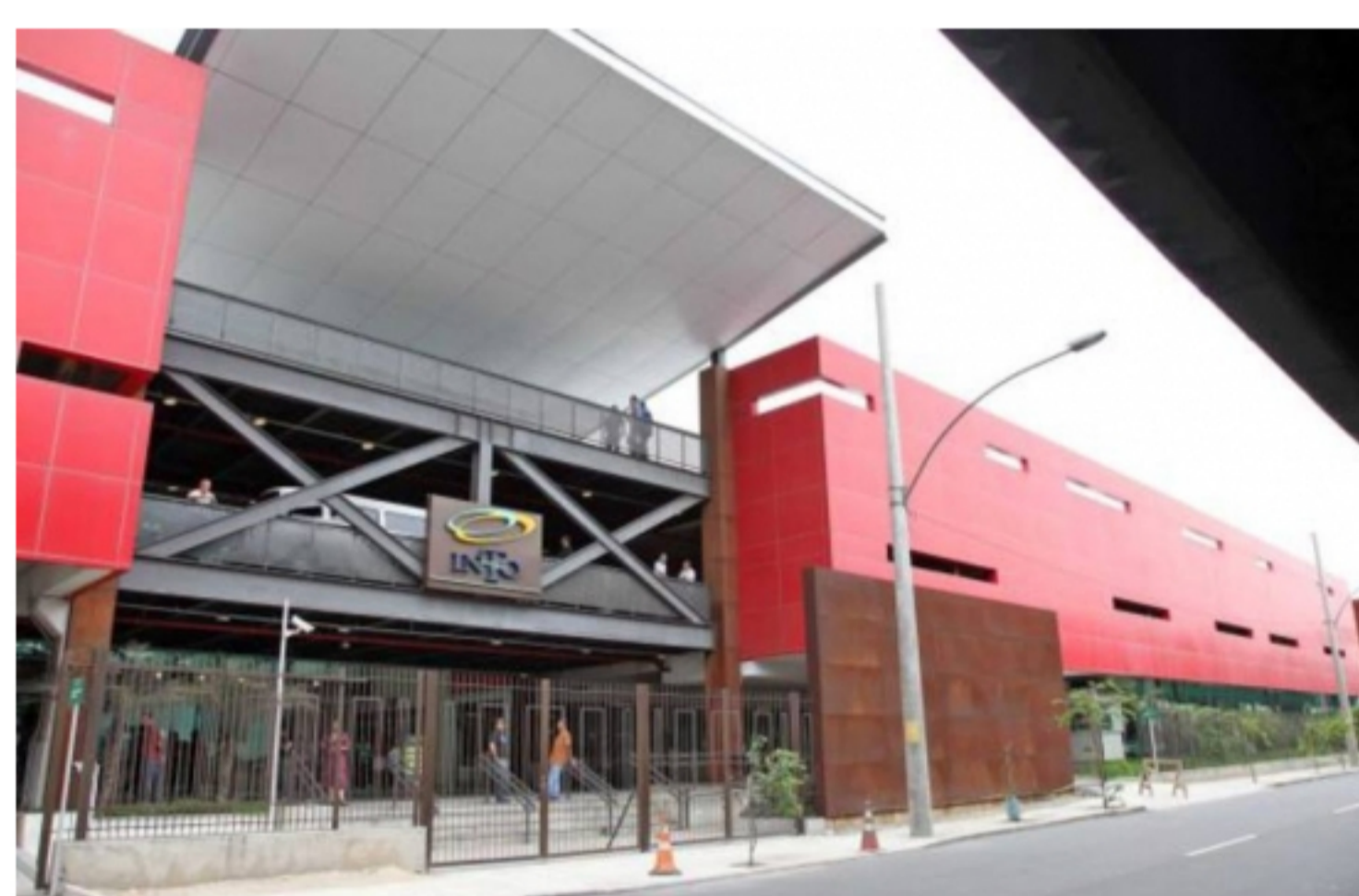
Em 2014, o material fornecido pelo Into beneficiou 477 pacientes

A segunda barreira para doação é o receio de que a retirada dos tecidos deixe o cadáver desfigurado. "As pessoas imaginam que o corpo ficará mutilado, mas não é assim. Após recolher o material, fazemos uma recomposição anatômica. Quem vê o corpo não percebe nenhuma diferença", afirmou Prinz.