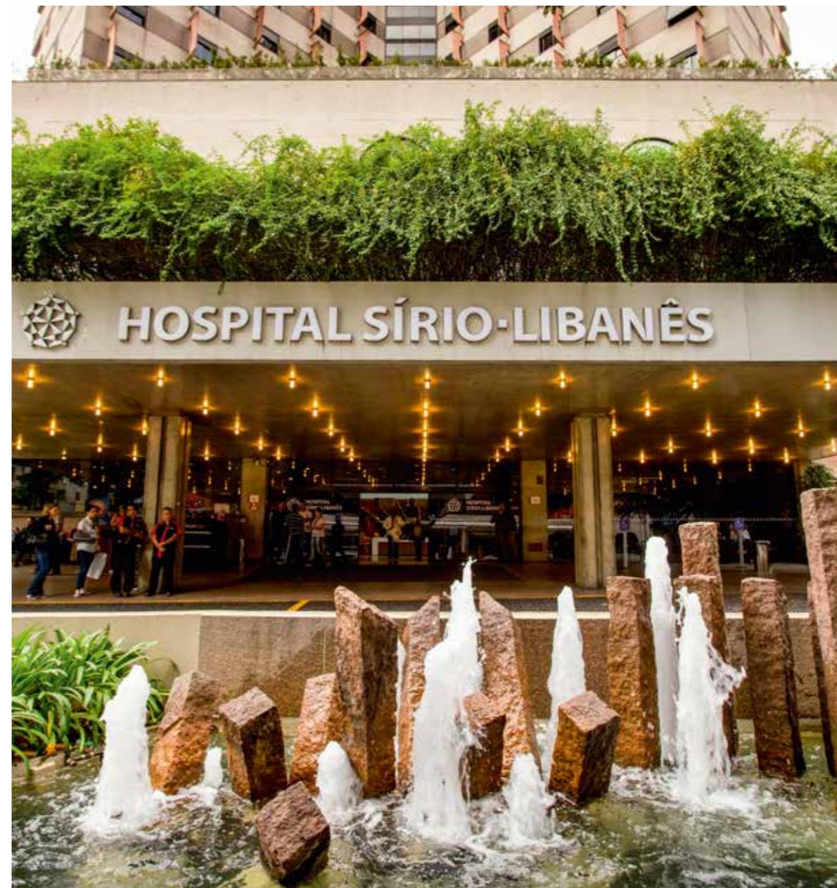
ZE GABRIEL LINDOSO

e anônimos vão até o hospital a procura dos melhores médicos do Brasil em diferentes áreas de atuação. São ao todo 30 centros e núcleos de medicina avançada. A excelência do Sírio-Libanês se estende também à saúde pública, onde o hospital administra instituições em parceria com o governo do estado e do município de São Paulo.